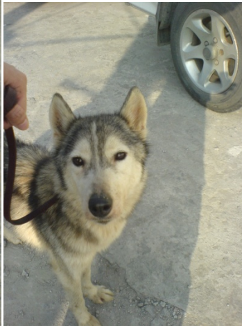
在回 SAA 途中